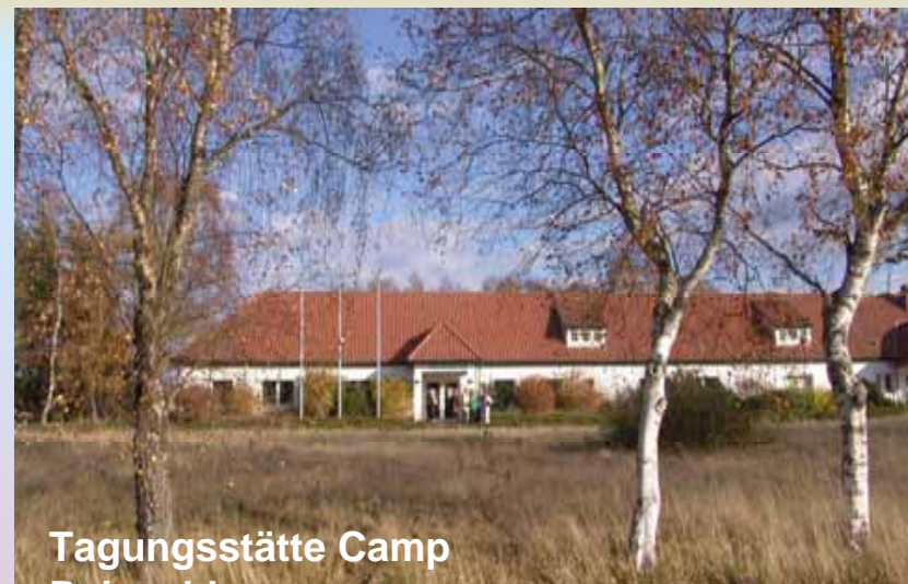
Tagungsstätte Camp Reinsehlen

Alfred Toepfer Akademie für Naturschutz (NNA)